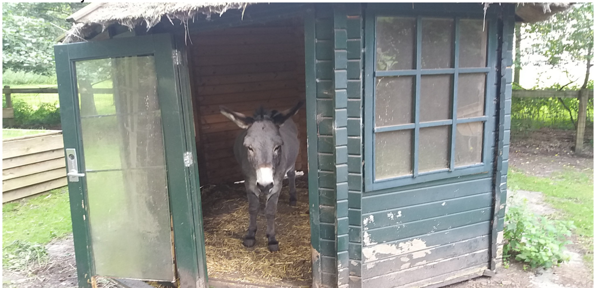
Ezel Nino onze bouwmeester

Het oude theehuisje van meneer Schaap was in zeer slechte staat en stond er vervallen bij.